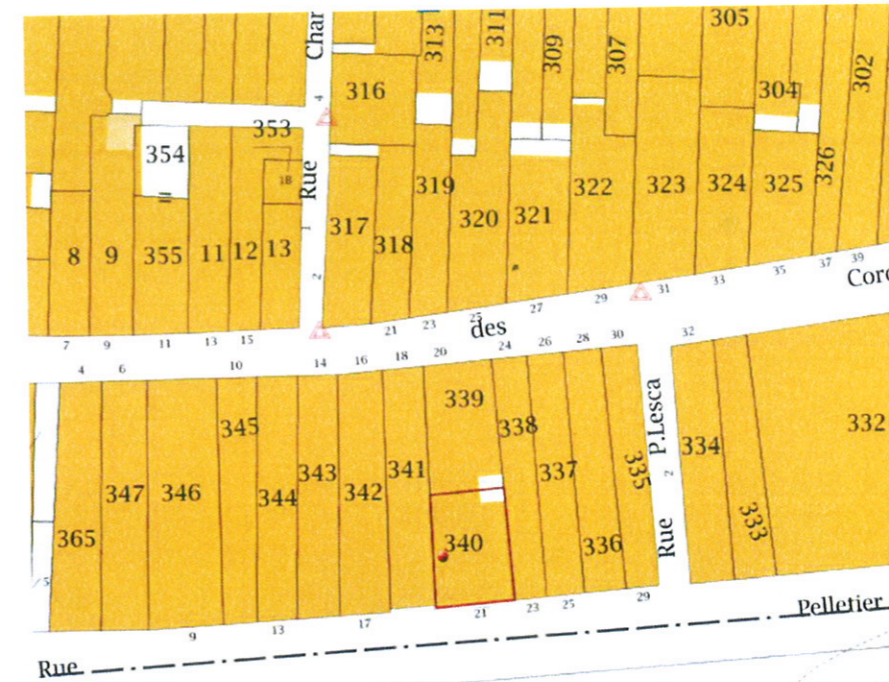
EXTRAIT CADASTRAL PARCELLE BZ 340