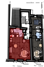
Tableau des surfaces habitables